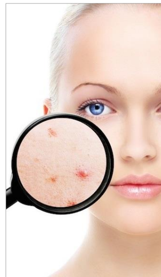
НЕРОВНОСТИ КОЖНОГО РЕЛЬЕФА, РУБЦЫ, РАСШИРЕННЫЕ ПОРЫ, ПОСТАКНЕ