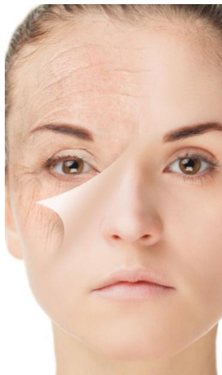
ВОЗРАСТНЫЕ ИЗМЕНЕНИЯ КОЖИ ЛИЦА, ПОТЕРЯ ОБЪЕМА ОТДЕЛЬНЫХ ЗОН ЛИЦА

КОМБИНАЦИЯ МЕТОДОВ RF-ЛИФТИНГА, МИОСТИМУЛЯЦИИ, МИКРОТОКОВ, ВИБРОМАССАЖА И ХРОМОТЕРАПИИ ПОЗВОЛЯЕТ В КОРОТКИЕ СРОКИ РЕШИТЬ ПРОБЛЕМЫ УВЯДАНИЯ КОЖИ, ПОВЫСИТЬ ТОНУС И ТУРГОР, СОКРАТИТЬ МОРЩИНЫ, ПОДТЯНУТЬ И УКРЕПИТЬ КОНТУРЫ ЛИЦА, УМЕНЬШИТЬ «ВТОРОЙ» ПОДБОРОДОК, УЛУЧШИТЬ ЦВЕТ ЛИЦА И ВЫРОВНЯТЬ МИКРОРЕЛЬЕФ КОЖИ.