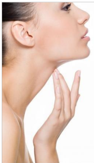
ВТОРОЙ ПОДБОРОДОК, ИЗМЕНЕНИЕ ОВАЛА ЛИЦА