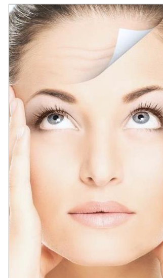
МОРЩИНЫ ГЛУБОКИЕ И МЕЛКИЕ