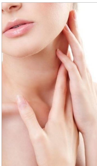
ВОЗРАСТНЫЕ ИЗМЕНЕНИЯ КОЖИ ШЕИ ДЕКОЛЬТЕ, ДРЯБЛОСТЬ