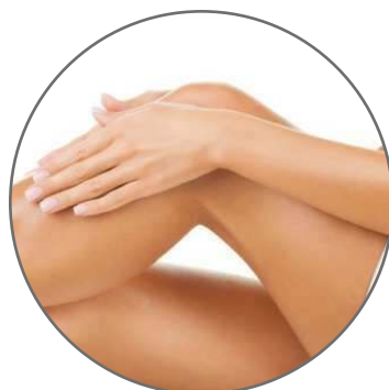
НОГИ И РУКИ