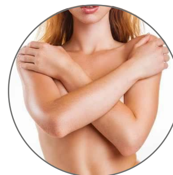
ДРУГИЕ ЧАСТИ ТЕЛА