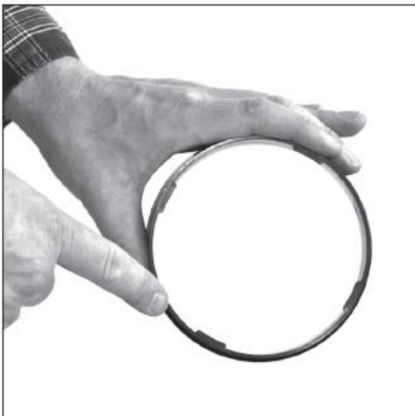
Адаптер быстрой фиксации. Примите во внимание положение байонетных замков.