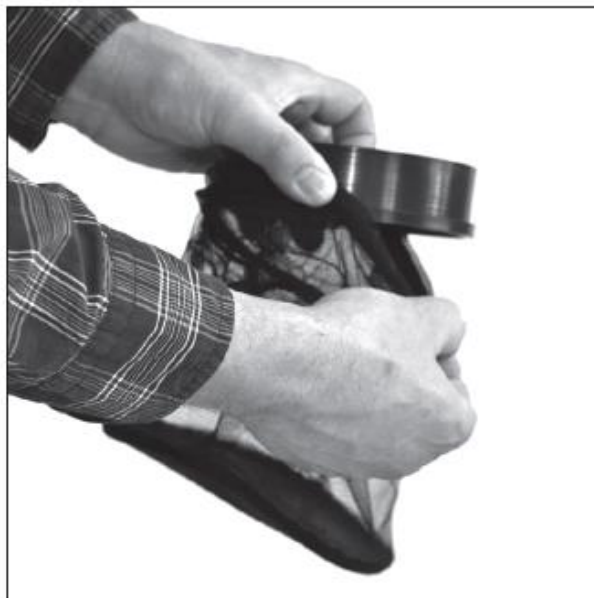
Присоедините сетку к адаптеру быстрой фиксации.