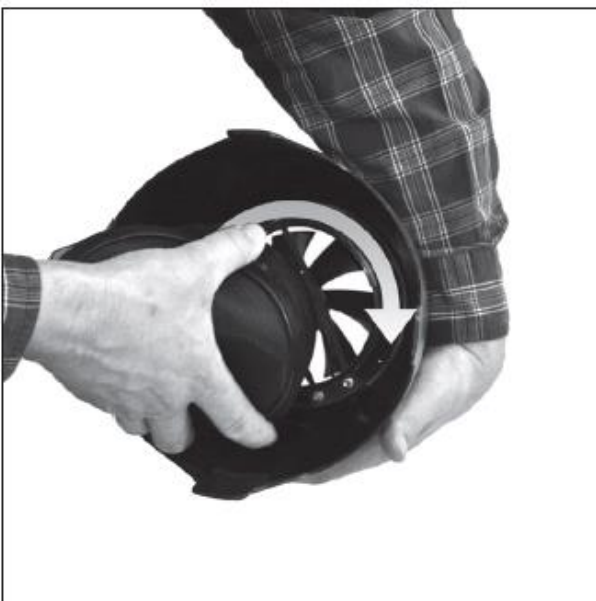
Поместите адаптер быстрой фиксации по направлению к ободу вентилятора и поверните по часовой стрелке.