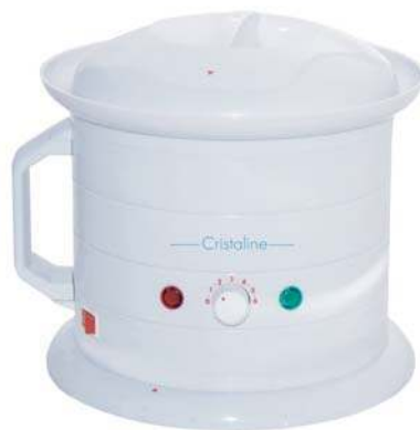
НАГРЕВАТЕЛЬ ВОСКА И ПАРАФИНА Модель: WH400

Арт: 1201018/G для нестандартных картриджей