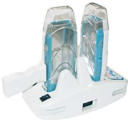
НАГРЕВАТЕЛЬ ВОСКА С БАЗОЙ / 2 КАРТРИДЖА Модель: WH201

Воскоплавы выпускаются в различных модификациях, соответствующих видам упаковки воска и его температурным характеристикам.