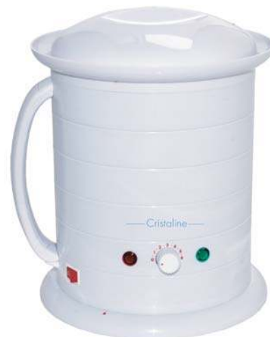
НАГРЕВАТЕЛЬ ВОСКА И ПАРАФИНА Модель: WH800

Вместимость нагревателя: емкости 800 гр Температурный диапазон: 35 – 100°C / 6 температурных режимов Комплектация: металлический стаканчик 800 мл, с ручкой и держателем для шпателя