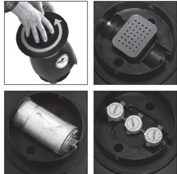
Для открытия отсека приманки: Нажмите и поверните против часовой стрелки.