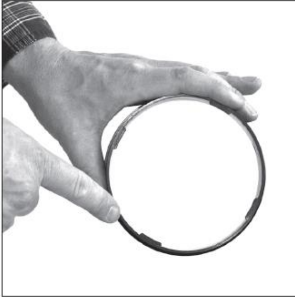
Адаптер быстрой фиксации. Примите во внимание положение байонетных замков.