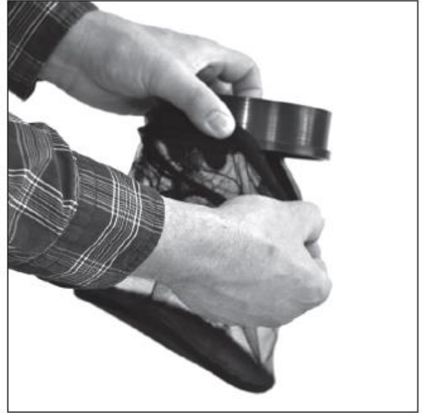
Присоедините сетку к адаптеру быстрой фиксации.