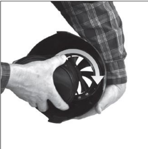
Поместите адаптер быстрой фиксации по направлению к ободу вентилятора и поверните по часовой стрелке.